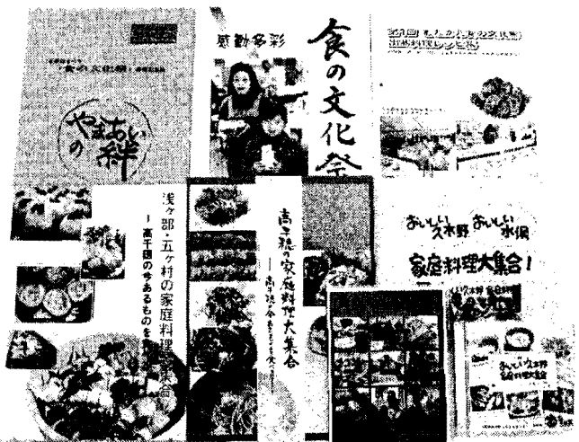
各地の「食の文化祭」「家庭料理大集合」の報告集やCD-ROM

(注)一部カラーの「食の文化祭」報告集程度であれば、そんなにはかからない。A4版、簡易製本、カラー二〇ページ、モノクロ九〇ページ、五〇〇部なら二〇万円くらいでできる。