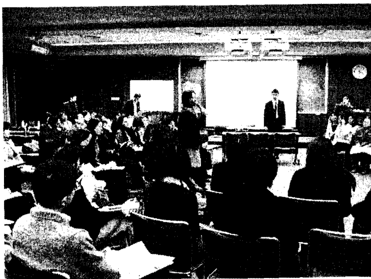
【食卓の向こう側セミナー】は西日本新聞社主催

ばあちゃん。できるだけ自然栽培をしているから、厳密な計画出荷は無理。有機JASマークのような高い手数料がかかる認証を取る資金もない。ここに思い至らない苦情の数々。人と人のつながりが分断された社会の弊害と言えないか。 単一作物の大量生産、広域流通のための野菜の規格化、それらに不可欠な農薬や化学肥料、機械への依存……。自然相手の農業は、国策で効率主義に転換。同会が活動し始めた七〇年代半ばは、「安全な食の喪失」が「顔が見える関係の崩壊」と表裏一体で進んだ時代だった。